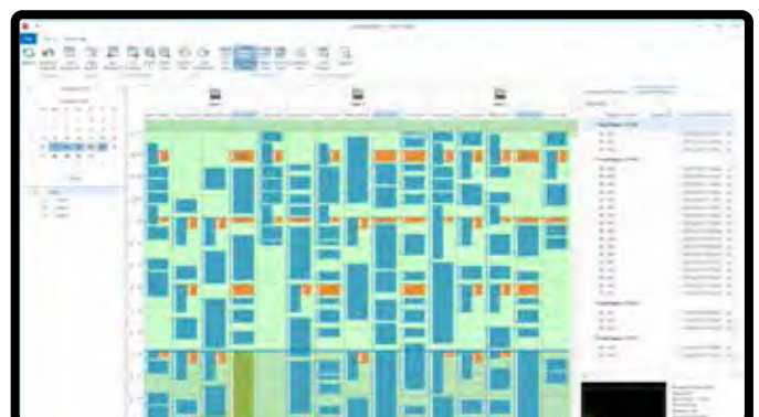
Pronostique fácilmente la producción por día, semana o mes