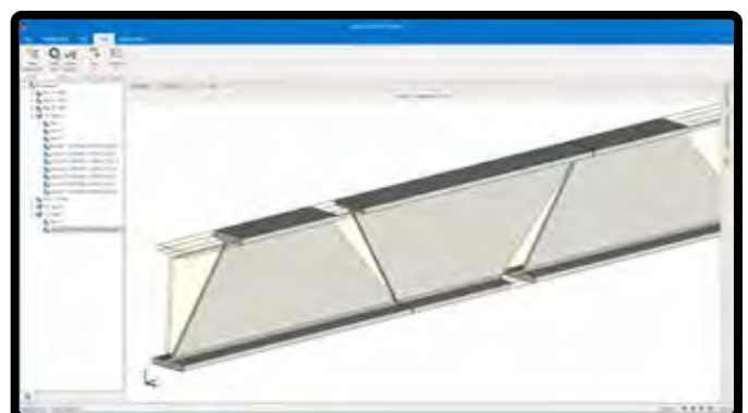
Visualice en 3D para mayor precisión.