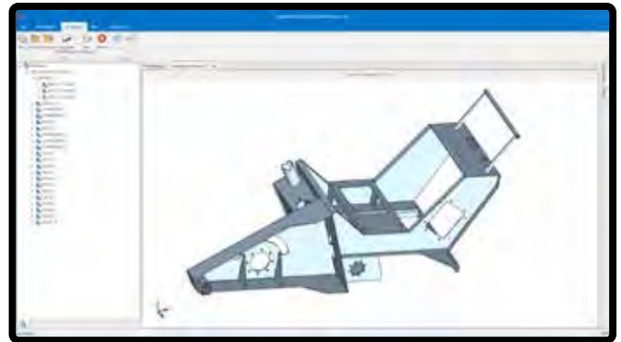
Figuras o conjuntos complejos