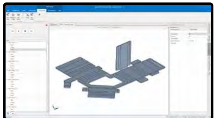
Inspección visual paso a paso